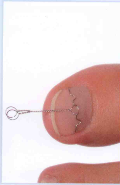
Die beiden Spangenschkel werden mit einer Schlaufe leicht zusammengezogen. Das Anheben des Nagels aus dem Nagelfalz bringt in der Regel rasch spürbare Erleichterung.