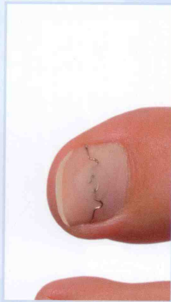
Die Spange wird versiegelt und gegebenenfalls mit Tamponade unterlegt.